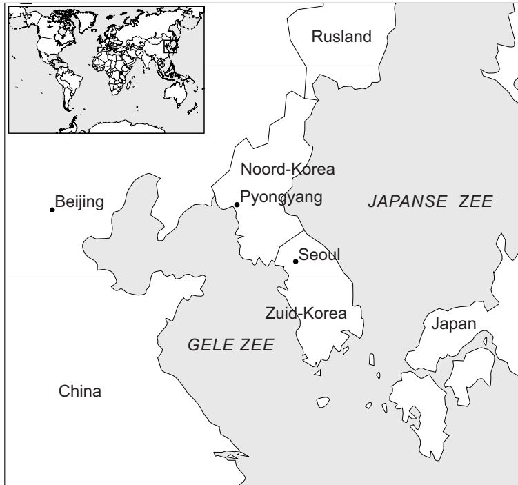
kaart van Noord-Korea en Zuid-Korea