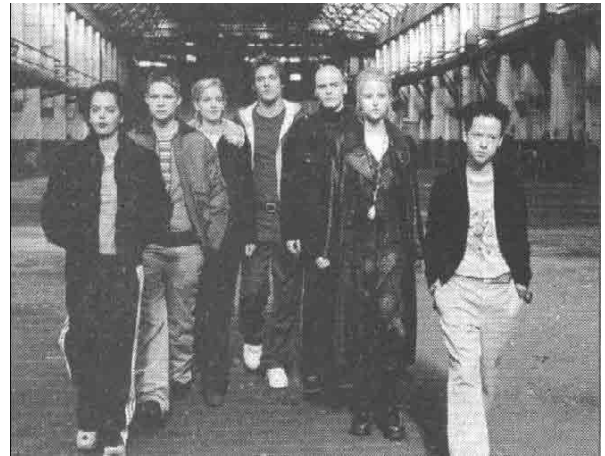
Die Clique: Sieben Jugendliche lassen sich im Kaufhaus einsperren und wollen feiern.

Die Geschichte spielt im größten Konsumtempel der Bundesrepublik. Als Vorbild fürs Film-Kaufhaus diente das Centro in Oberhau-