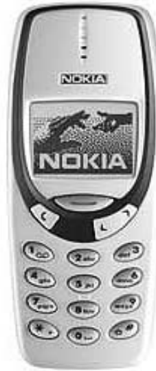
Handys geben ungesunde Strahlungen ab. Ein neues Material soll die Strahlung vermindern.

Das schützende Material kann zwischen zwei Plastikschichten gelegt werden, die die Hülle des Handys bilden. Die meisten Strahlen (90 Prozent) werden dann von der Schicht geschluckt. Sie gehen nicht nach außen. Der Kopf bekommt so kaum mehr schädliche Strahlen ab.