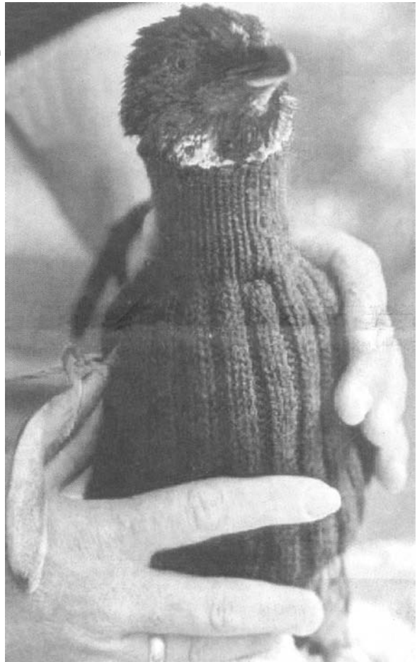
Er ist von Kopf bis Fuß auf Wolle eingestellt! Dieser Zwerg-Pinguin ist modisch voll im Trend: Im Selbstgestrickten hat es der Kleine auch im Winter mollig warm.

So viel, so gut. Mit der überwältigenden Hilfsbereitschaft hatte niemand gerechnet: Jetzt türmen sich 10.000 Strickpullis in den Räumen der kleinen Umweltorganisation. Und der Postbote bringt täglich mehr. Viele Modelle werden an andere Pinguin-Stationen weitergereicht: für den Notfall.