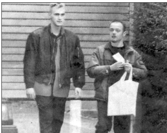
Die dümmsten Bankräuber Deutschlands waren nach dem Urteil wieder auf freiem Fuß.