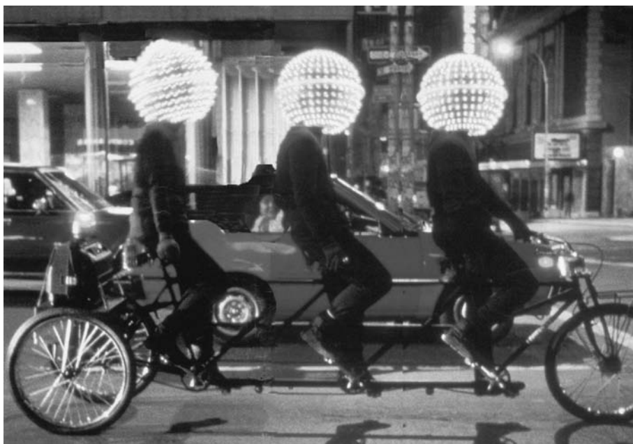
Ovnis urbanos, obra de arte de Eric Staller

« OVNIS URBANOS »: ASÍ LLAMA EL ARTISTA ERIC STALLER SU BRILLANTE MONTAJE. TRES PERSONAS RECORREN LAS CALLES EN UNA BICICLETA CON SUS 5 CABEZAS CUBIERTAS POR ENORMES GLOBOS LUMINOSOS. LAS LUCES SE ENCIENDEN Y APAGAN SIMULANDO UN MOVIMIENTO ROTATORIO. LA OBRA MÓVIL DE ESTE ORIGINAL ARTISTA RECORRE YA 10 ESTADOS UNIDOS Y EUROPA.