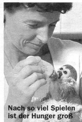
Nach so viel Spielen ist der Hunger groß