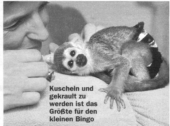
Kuscheln und gekraut zu werden ist das Größte für den kleinen Bingo