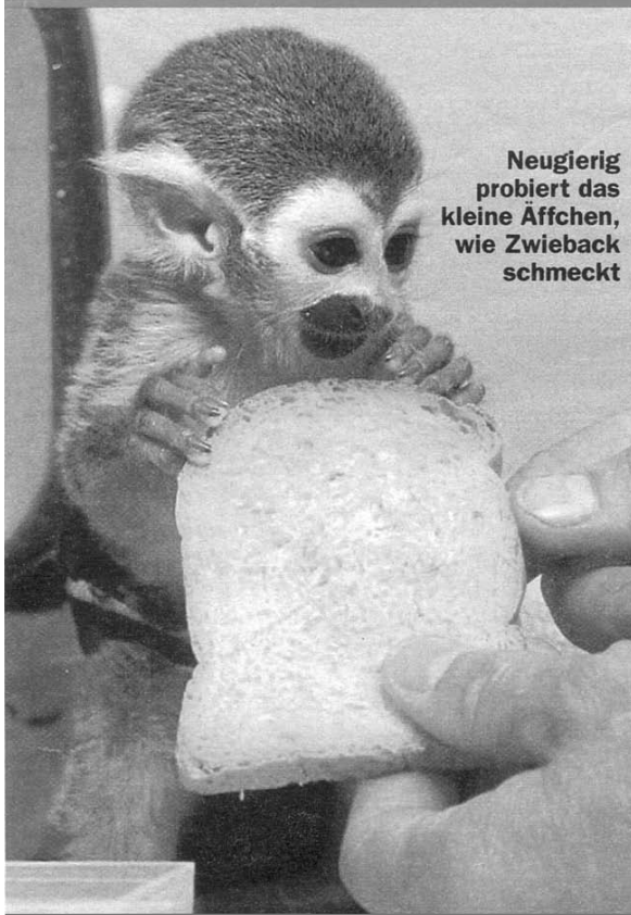
Neugierig probiert das kleine Äffchen, wie Zwieback schmeckt